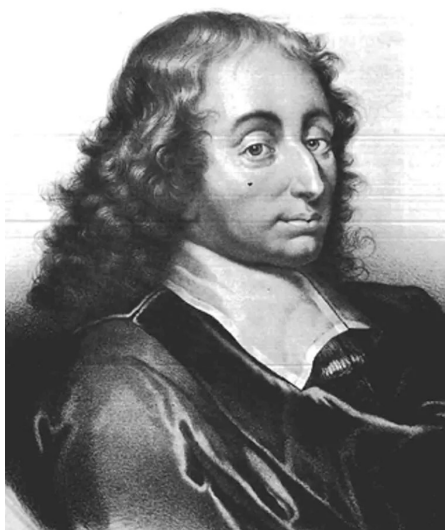
Portrait du philosophe Blaise Pascal.

La vie ne s'entretient durablement que si nous y cultivons le goût et le sens du sens, en ayant à l'esprit que quand il le veut bien, comme l'exprime Blaise Pascal dans ses Pensées , « l'homme passe infiniment l'homme ». Pour le meilleur.